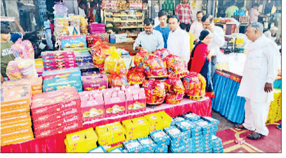
सीवन। मेन बाजार में लगी दीपावली की रौनक व सजी दुकानें।

पारंपरिक मिठाइयों के साथ सूखे मेवों की बिक्री में खासा इजाफा