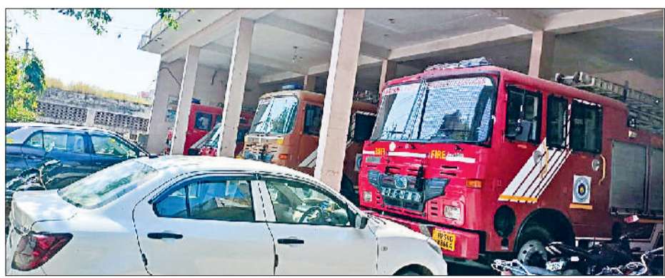
जींद। फायर स्टेशन में खड़ी गाड़ियां।