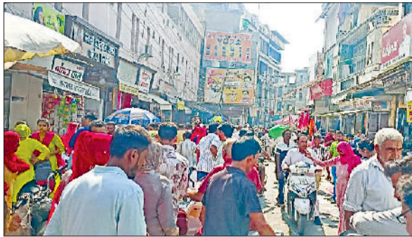
जौद। दीपावली पर्व पर बाजार में उमड़ी भीड़।

जिलेभर में रविवार को छोटी दीपावली का पर्व श्रद्धा व धूमधाम से मनाया गया। खरीददारी के लिए ग्राहकों की भीड़ सुबह ही बाजार में पहुंचना शुरू हो गई। दिन चढ़ने के साथ ही बाजार पूरी तरह से ग्राहकों से गुलजार हो गया। बाजार में ऐसी कोई दुकान नहीं थी जहां ग्राहक न हों। दुकानदारों ने अपनी विक्री बढ़ाने के लिए अनेक स्क्रीमें शुरू की हुई थी। जिसके चलते बाजार में आए लोगों ने भी इन स्क्रीमों का जम कर लाभ उठाया। बाजार में ग्राहकों को लुभाने के लिए हर दुकानदार ने अपनी दुकान के आगे सेल लगाई हुई थी। सेल पर मौजूद लड़के चिल्ला-चिल्ला कर कहीं हर माल सौ-सौ रुपये में तो कहीं 150-150 रुपये की आवाजें लगा रहे थे। इसके अलावा कहीं एक कमीज के साथ एक गिलास मुफ्त मिल रहा था तो कहीं कूपन सिस्टम के माध्यम से लोगों को रिझाया जा रहा था। दोपहर होते-होते बाजार में लोगों की इतनी भीड़ जमा हो गई कि आने जाने वाले लोगों को भारी परेशानी का सामना करना पड़ा। बाजार में