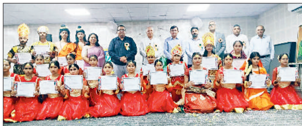
कैथल। दीपावली पर्व के दौरान जाट शाइनिंग स्टार पब्लिक स्कूल कैथल के विद्यार्थी।