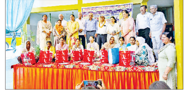
जरूरतमंदों को सामान वितरित करते अखिल भारतीय मानव सेवा समिति के पदाधिकारी।