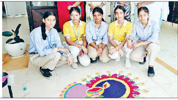
श्री पार्श्वनाथ स्कूल में रंगोली प्रतियोगिता के दौरान मौजूद विद्यार्थी

दीपावली का त्यौहार आते ही नगर के बाजार पूरी तरह से सज-धज कर तैयार हो गए हैं। चारों ओर रोशनी, रंग-बिरंगी सजावट और खरीदारों की चहल-पहल से बाजारों में उत्सव का माहौल दिखाई दे रहा है। मुख्य बाजार में लोगों की भारी भीड़ उमड़ रही है। हर वर्ग का व्यक्ति अपनी पसंद और जरूरत का सामान खरीदने में व्यस्त है। कपड़ा, मिठाई, ड्राई फ्रूट, सजावट का सामान, कंबल-रजाई, इलेक्ट्रॉनिक उपकरण, मोबाइल, मोटरसाइकिल आदि की दुकानों पर खरीदारों का तांता लगा हुआ है। दुकानदारों के चेहरे पर भी रौनक देखी जा सकती है। दीपावली ऐसा पर्व है, जिसे हर व्यक्ति पूरे उत्साह