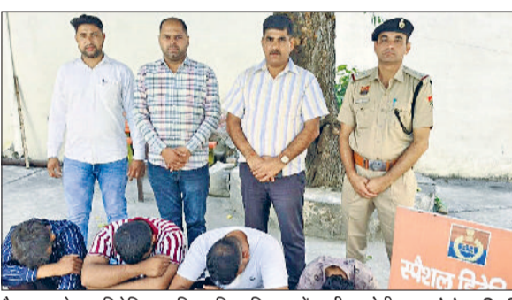
कैथल। स्पेशल डिटेक्टिव यूनिट पुलिस गिरफ्त में सभी आरोपी।