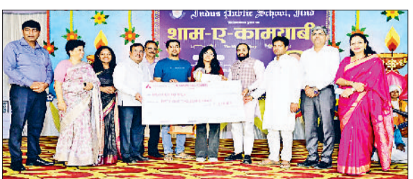
जौद। इंडस स्कूल में होनहार छात्रों को सम्मानित करते हुए।